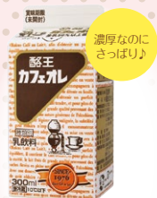
濃厚なのに さっぱり♪

酪王カフェオレ 【酪王協同乳業】 TEL0243-36-3175 本宮市荒井字下原14