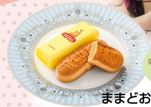
ずっと 変わらない やさしい 味わい

さくらゆべし 【かんのや 郡山駅おみやげ館】 (2月中旬～4月中旬限定販売) TEL024-934-2316 郡山市燧田195(郡山駅構内1F)