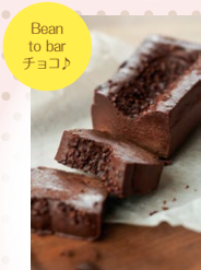
Bean to bar チョコ

ままだる 【三万石 郡山おみやげ館】 TEL024-923-1267 郡山市燧田195(郡山駅構内1F)