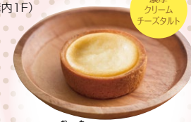
濃厚 クリーム チーズタルト