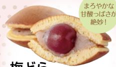
まろやかな 甘酸っぱさが 絶妙！

梅どら 【郡山銘菓庵大黒屋】 TEL024-932-3517 郡山市中町14-8 (フロンティア通り)