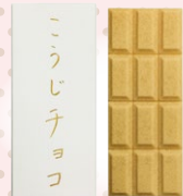
酒蔵の 糖スイーツ！

源平だんご 【旅館源平】 (3月上旬～4月末の限定販売) TEL024-922-2496 郡山市開成3-4-3