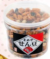
とまらない サクサク 食感！

フォンダンショコラ 【富久栄珈琲うすい店】 TEL024-983-3601 郡山市中町13-1 うすい9F