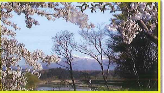
⑥ 小和滝桜垣間見る安達太良