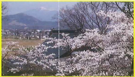
⑩ 山清寺境内桜垣間見る安達太良