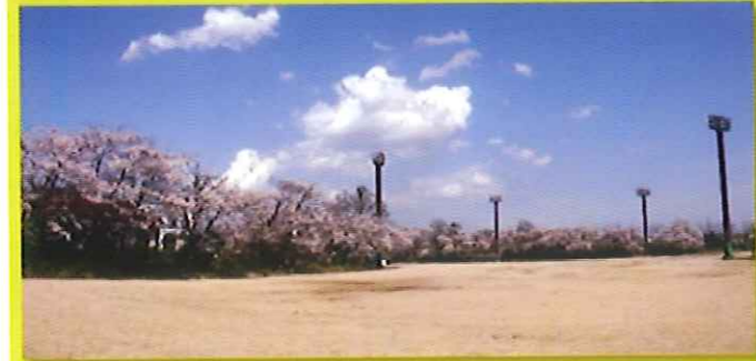
15 日和田スポーツ広場