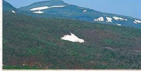
箕輪山 連峰最高峰の山で、広い山頂からの眺めは抜群。東に福島、二本松市街、南に鉄山、西に磐梯山、飯豊連峰、北に鬼面山を越えて百鬼の山々が眺められます。