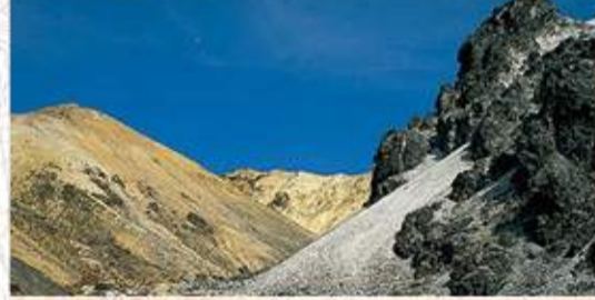
鉄山 噴火でえぐられ、ゴツゴツした岩からできた、古来「鉄城」と呼んだ名にふさわしい山容。火口内に湧く温泉は岳温泉までひかれています。避難小屋有り。