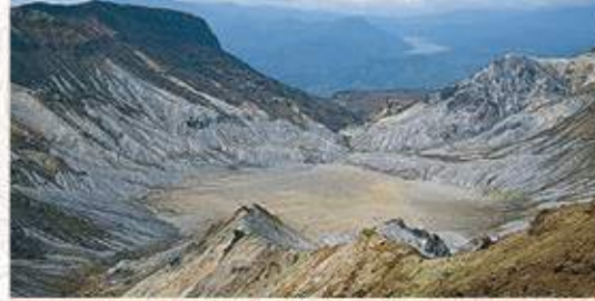
沼の平火口 直径1.4kmの丸い形の大爆発火口。ほとんど植物も生えない荒涼とした風景が火山噴火のすさまじさを物語っています。明治33年(1900)の新火口がほぼ中央にあります。