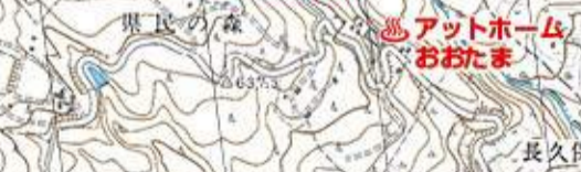
アットホーム おおたま