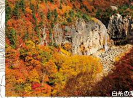
白糸の滝、胎内岩、障子岩、沼ノ平、沼尻温泉、中ノ沢温泉