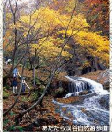
あだたら渓谷自然遊歩道