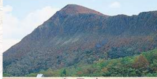
鬼面山 南側斜面は比較的ゆるやかですが、北東は断崖絶壁。箕輪山の紅葉を眺めるのに絶好のポイント。北へ下れば土湯峠を越え、ブナ林を抜けて野地温泉へ。