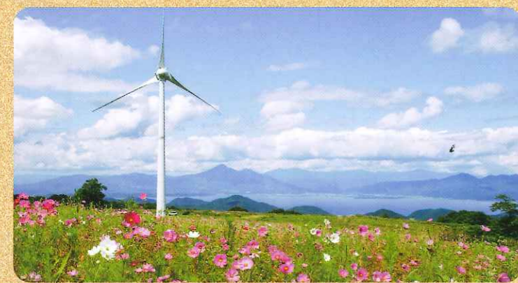
布引風の高原から見る「磐梯山と猪苗代湖」