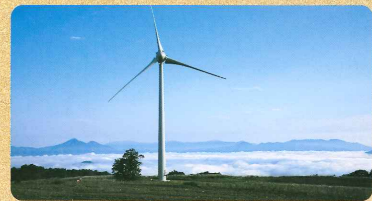
高原の眼下に「云海」を見ることができます。