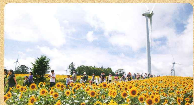
8月下旬頃には、ひまわり畑が一面に広がります。